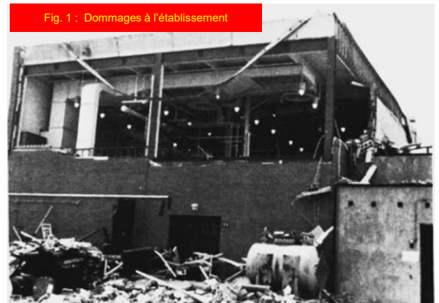
Fig. 1 : Dommages à l'établissement

[Référence : Kohlbrand, H. T., Plant/Operations Progress 10 (1), pp. 52-54 (1991).]